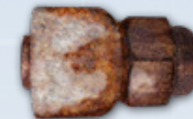
Mitbewerber B nach 1.000 Stunden ASTM B117 (ISO 9227) Salznebeltest