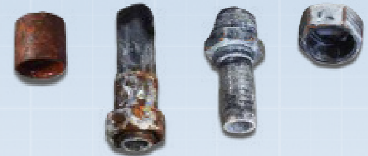
Mitbewerber A nach 1.000 Stunden ASTM B117 (ISO 9227) Salznebeltest